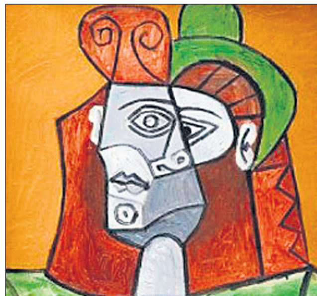
Femme au Chapeau Vert de Pablo Picasso