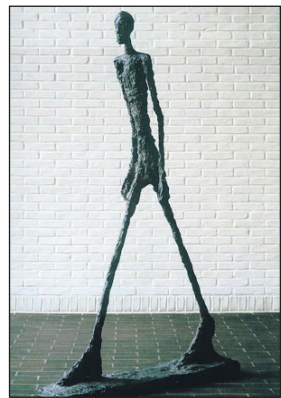
El Hombre que Camina

La Fundación Commerzbank recauda 74 millones de euros por una escultura del suizo Giacometti, que se ha convertido en la obra adquirida en una subasta pública más cara de la historia. El Hombre Que Camina fue vendida a un comprador anónimo. (Pág. 12)