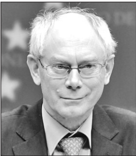
Herman van Rompuy

El presidente del Consejo Europeo, Van Rompuy, comprometió su respaldo al Estatuto Único de Fundaciones en el transcurso de su intervención en Bruselas ante mil representantes del sector. (Pág. 10)