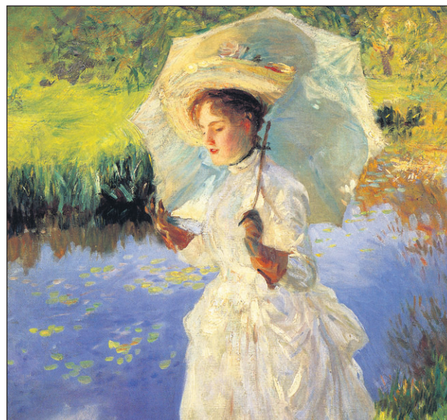
Morning Walk, John Singer Sargent, 1888. Colección privada. 421

Terra Foundation, copatrocinadora la exposición con Art Museum. (Pág. 7)